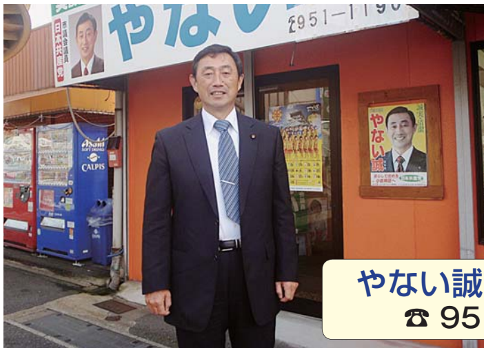
やない誠市政事務所 ☎ 951-1190