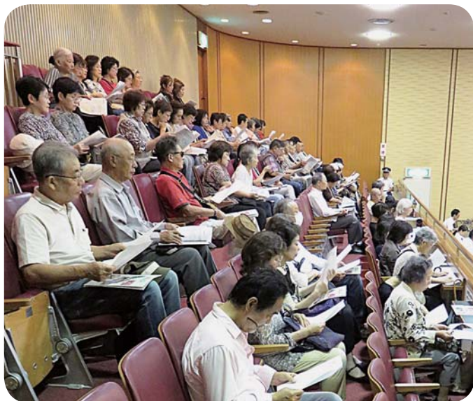
（「健康づくりセンター」を廃止しないよう求める日本共産党議員の本会議質問を聞くため、傍聴にきた地元の利用者たち。9月11日）

八幡市民会館・図書館、市立幼稚園に続き、こんどは市民の健康づくりセンター廃止を打ち出し、強行しようとしています。