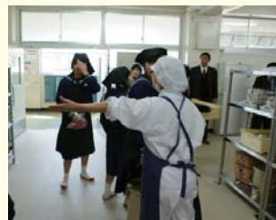
(中学校での給食の準備風景)

学校給食の直営校で働くパート調理員266人が、来年3月末で雇い止めになろうとしています。日本共産党は、10年、20年と勤めてきた人が多く、衛生管理、大量食材の調理技術など熟練工の人たちを使い捨てにすべきではないと追及しました。