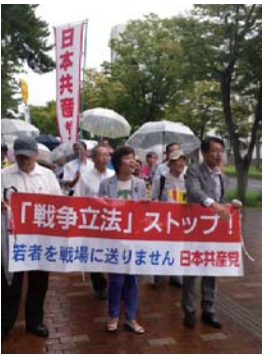
(戦争法反対のデモ。9月6日)

これに対し市長は、「国民にとって重要な案件だ。このため政府においては、最後まで国会で慎重かつ十分な議論をしていただきたい。国会での議論を注視していきたい」と、答えるにとどまりました。