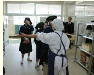
(中学校での給食の準備風景)

学校給食の直営校で働くパート調理員266人が、来年3月末で雇い止めになろうとしています。日本共産党は、10年、20年と勤めてきた人が多く、衛生管理、大量食材の調理技術など熟練工の人たちを使い捨てにすべきではないと追及しました。