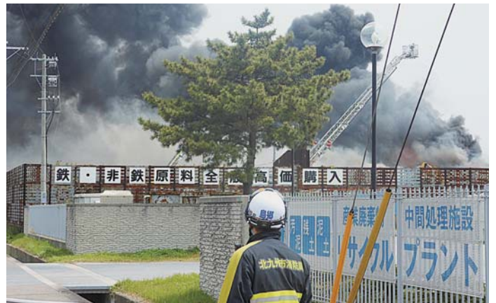
2013年6月時の鉄工団地の金属スクラップ火災

日本共産党市議団は、金属スクラップや有価物を含む廃棄物の規制、指導を強化できるように関係規定の改正を政府に求める意見書を提出し、全会派の賛同で可決しました。