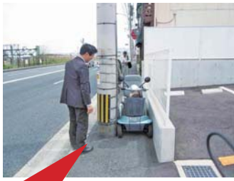
電動カートも通過できない