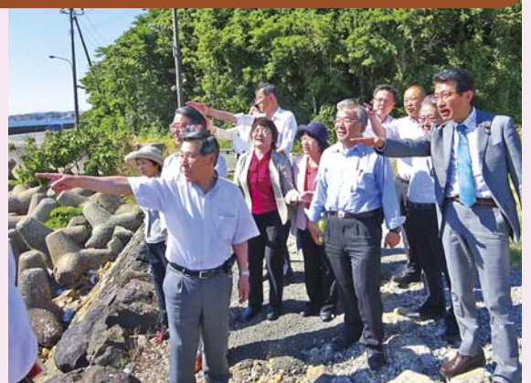
(下関側から下関北九州道路の予定ルートを視察する日本共産党市議団や国会議員。5月27日)