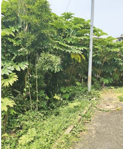
虫や蛇が出たと相談があった空き地

9月議会本会議で、放置された空き地のかけ崩れ対策など、本会議質問をしました。その一部を報告します。