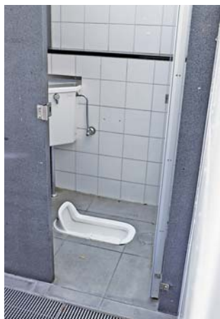
手すりもない、公園の和式トイレ

私は6月議会で、複数便器のある公園は市の主導で1つは洋式にするよう提案し改善を求めています。引き続き9月議会でも日本共産党は公園トイレ洋式化を取り上げ質問しました。市長は「7月に実施したアンケートで、194団体の9割から回答があり、160箇所洋式トイレの