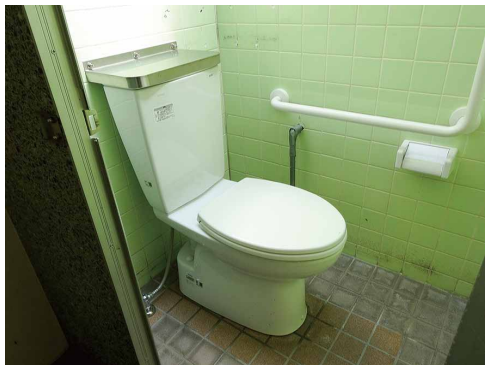
平成29年度に改修された「鞆ヶ谷ほたる公園」のトイレ

「膝が悪くて公園のトイレが使えない、どうにかしてほしい」と、高齢の方からの相談を受け、6月議会で公園トイレの洋式化を求めました。市は7月自治会にアンケートを行い洋式化への要望が138か所寄せられました。本年度は1000万円の予算が付き、昨年の2倍以上の30か所が改修されます。洋式化するためには自治会等からの要望書が必要です。