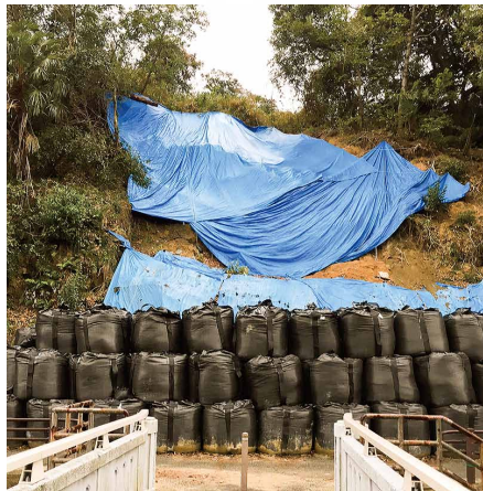
板櫃町のがけ崩れ現場