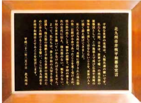
市庁舎正面玄関ホール左壁面に展示されている「非核平和都市宣言」全文。

建設予定の平和資料館の計画は、市が制定した「非核平和都市宣言」の展示方法があいまいです。