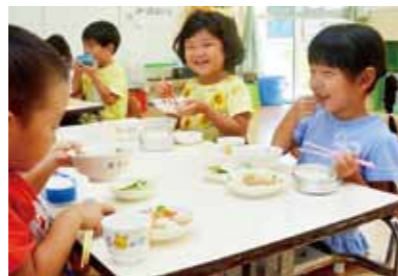
高知県は8割の自治体で無償化

しかし市は、財源が新たに必要となること、在宅子育てとのバランスなどを理由に拒否しました。