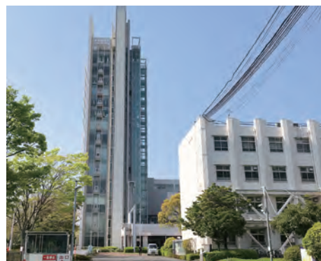
▲北九州市立大学北方キャンパス

市長は「受益者負担」などをあげて制度改定に背を向けましたが、今後とも要求します。