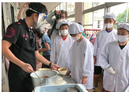
▲給食の準備は一方通行の廊下で

北九州市が今年度から小学校全学年で実施する35人学級は、少人数学級の推進の第一歩です。しかし問題は、先生を独自に増やす計画がないことです。前年度の3学期は、市内16校で育休・産休・病休の代わりの先生が確保できず、現場の先生に大きな負担となりました。